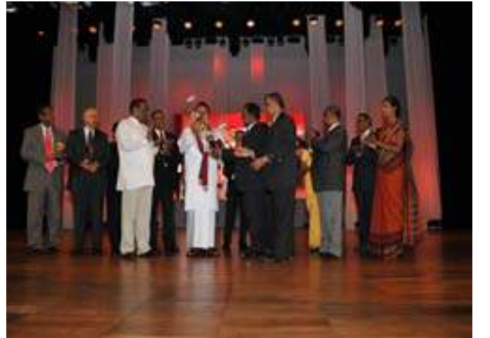
H.E. The President presenting awards to the Administrative Officers retired and serving at present at the Ministry of Public Administration and Home Affairs