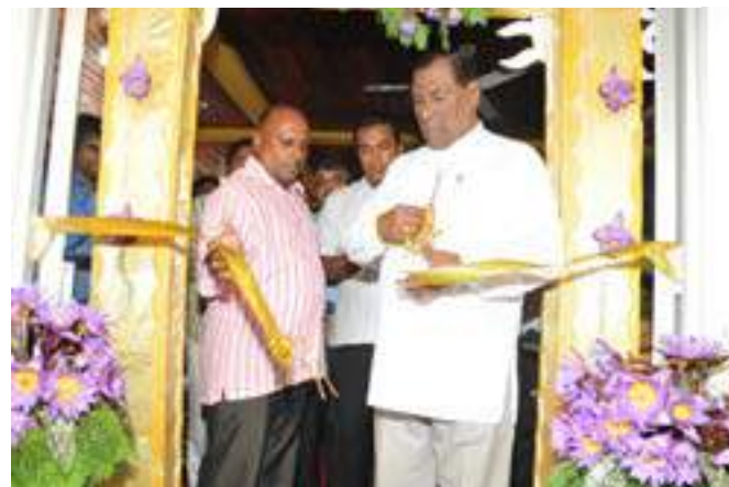
Opening of new Auditorium at Divisional Secretariat, Pelmadulla