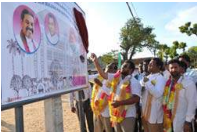
Laying of foundation stone for the four storied District Secretariat Building in Mannar