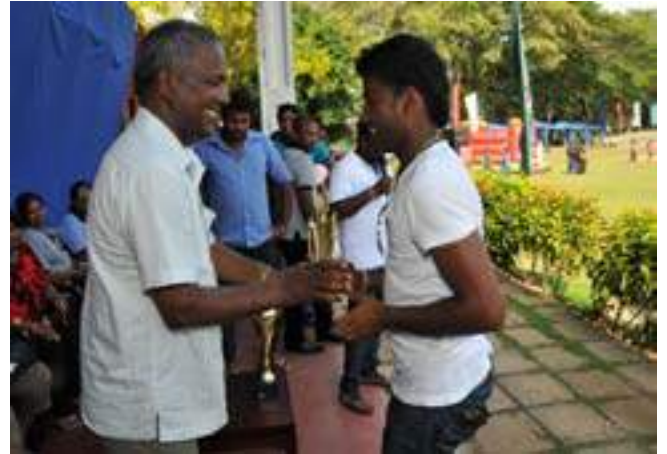
Annual Sinhala and Tamil New Year Sports Festival