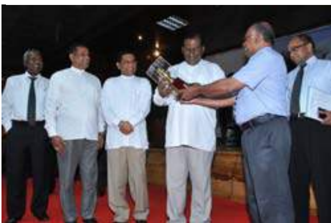
Awarding of Plaques to Hon. Minister and Deputy Minister by the Government Agent, Nuwara Eliya