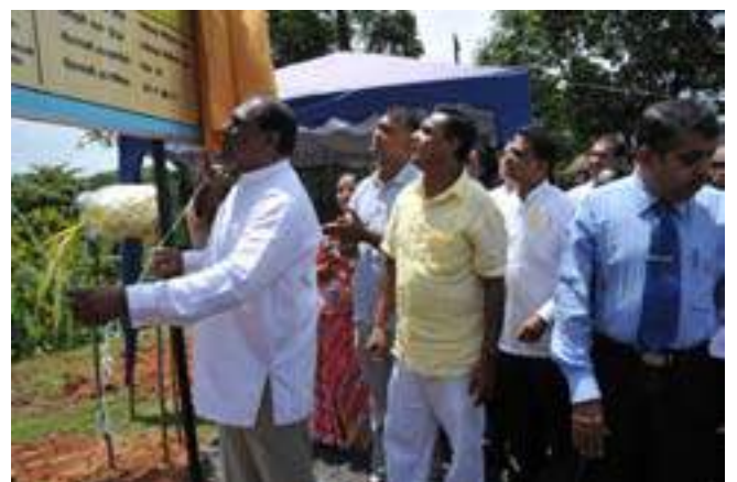
Ceremony of laying foundation stone to the new Administrative Complex, Rathnapura