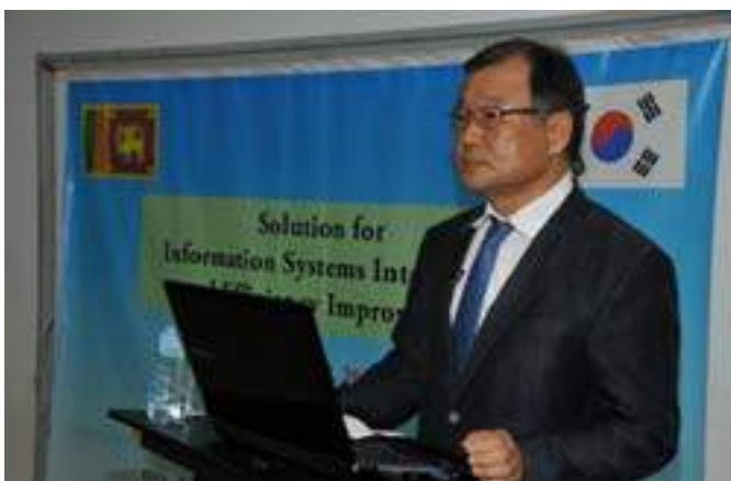
Discussing the issues related to the Information Technology in the Ministry with "Koika"