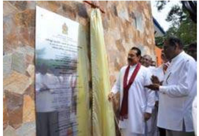
Opening of new Divisional Secretariat, Rathnapura