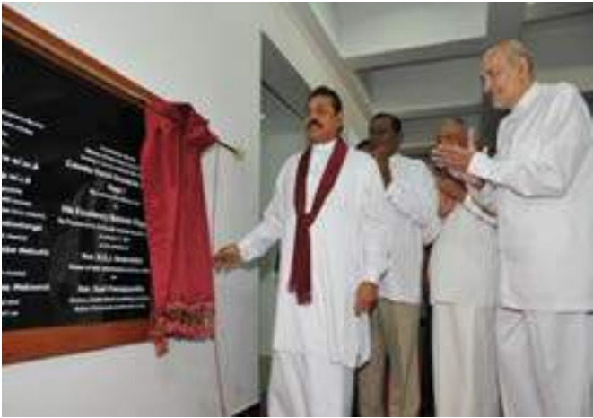
Opening of Office of the Government Agent, Colombo