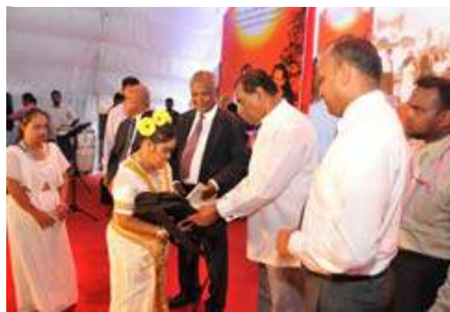
"Buhuman" festival held on the Pensioners' Day