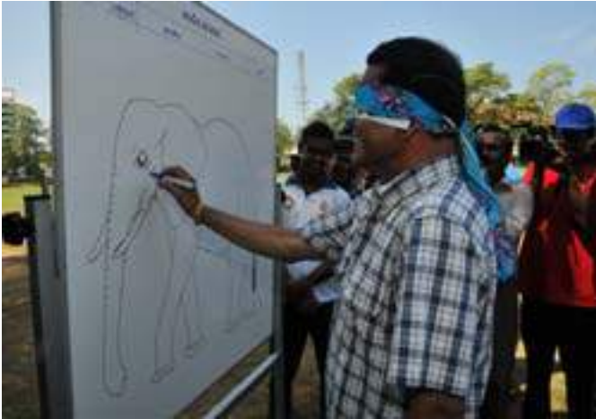
Annual Sinhala and Tamil New Year Sports Festival