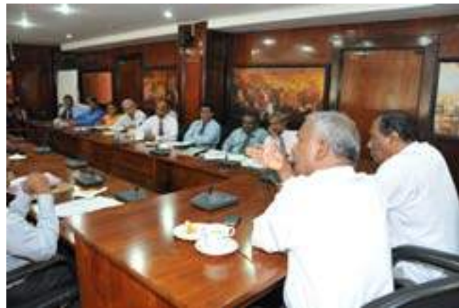
Discussing the issues of the Engineers' Service with hon. Minister